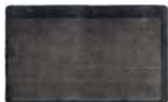
9 DIBBETS CAMBRÉ TEPPICH CM 400X400